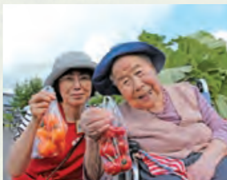
(昨年の朝市の様子)

毎年恒例、てくてく朝市“の時期がやってきました!!採れたて新鮮野菜やかわいい手作り雑貨など…。ぬくもりの家えん駐車場で、7月6日より毎週土曜日朝9時から開催です。どれも完売次第終了となっておりますので、お早めのお越しをオススメいたします。