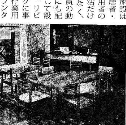
キッチンに境をユニットを配置

「当然りを考慮し、中庭を囲むように建設。通りから小規模多機能のリビングと、地域交流スペースの様子が見える」